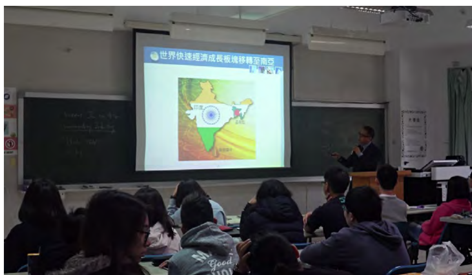
圖 2. 「臺灣雙印暨新興市場創新產業合作協會」秘書長何明豐博士與嘉義大學同學分享物聯網、智慧城市的印度市場商機

接著，何明豐博士介紹世界快速成長的經濟體已由中國逐漸移往南亞國家的趨勢，尤其印度市場這幾年的發展迅速，同時該國總理大力進行改革，經商環境大幅改善，已取代中國成為經濟成長率最快的國家，及最大的外資直接投資國家。但是臺灣廠商卻對此一市場較陌生，因此是屬於年輕一代的機會，值得大家投入研究與關注此一市場。同時印度政府大力推動「智慧城市政策(Smart Cities Mission)」，將在全印度建設 100 座智慧城市，著手提升智慧能源、環境、交通、資訊科技、建築等領域，以水資源、環境衛生、廢棄物管理、住宅、綠能、大眾運輸系統、能源供應、資通訊網路布建等基礎建設為主，預估商機高達 500 億美元。許多智慧城市的基礎就是物聯網系統，由個別物聯網系統模組切入做為所有智慧城市的「積木」，將有許多可以重複施作的商機。為了滿足印度智慧城市的大量缺口，也將會孕育了許多物聯網系統的創新創業機會。同時勉勵同學們不分科系都要關注以印度為中心的南亞市場之經濟發展，可長期關注「臺灣雙印暨新興市場創新產業合作協會」的動態及訊息，將可掌握新興市場的新發展動向。